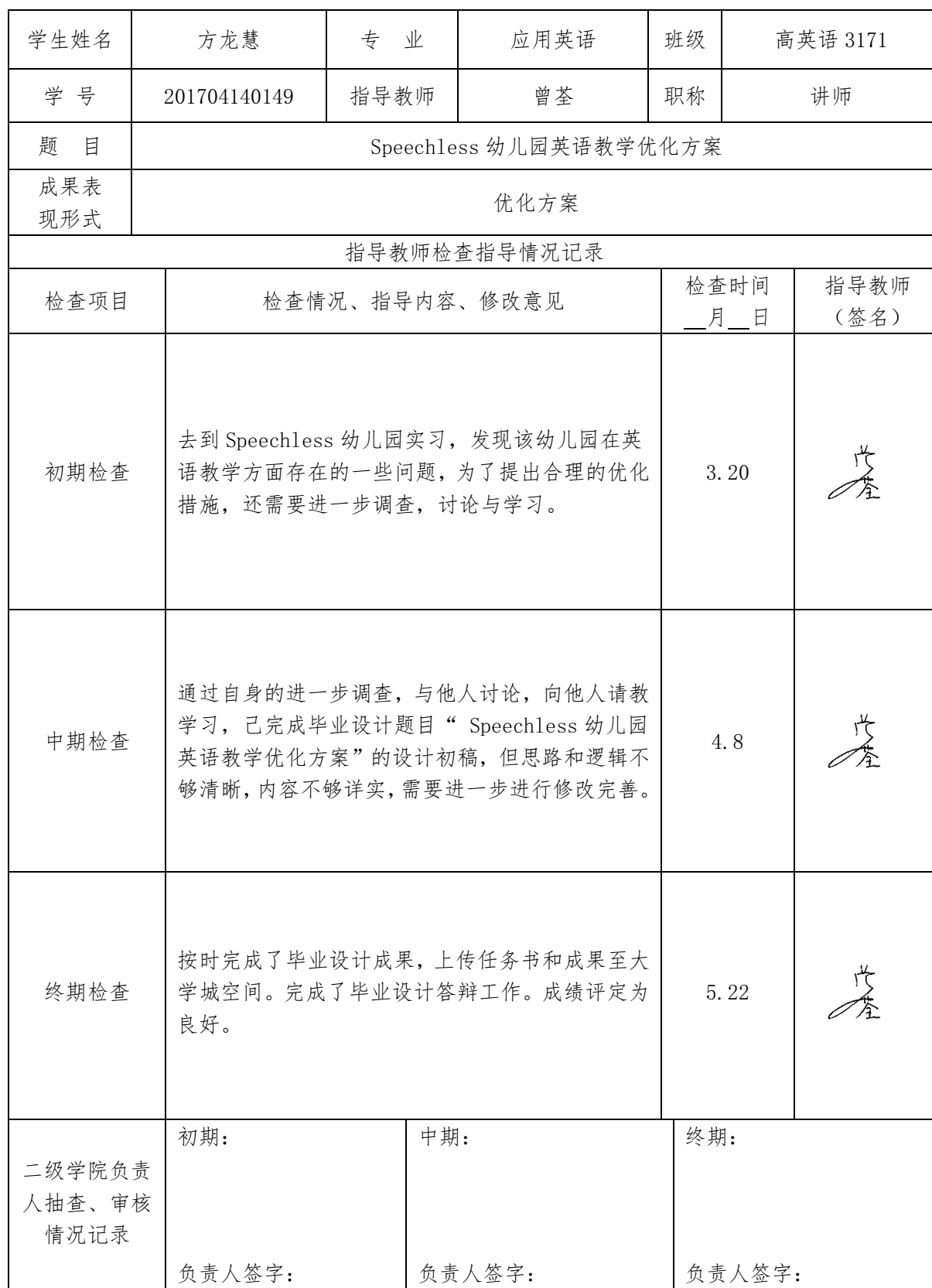
湖南石油化工职业技术学院毕业设计指导检查记录