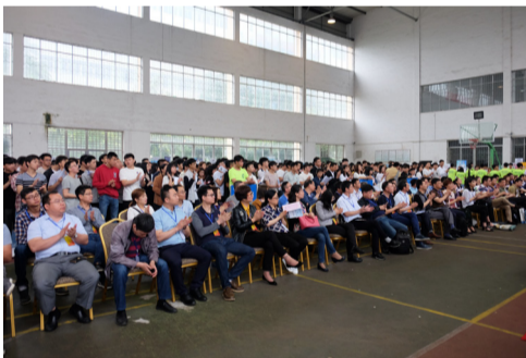
企业招聘人员和学生参加开幕式