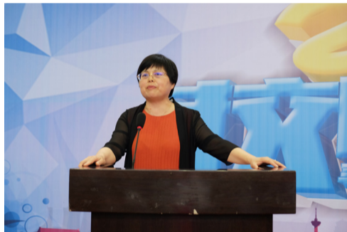
符文文主持开幕式