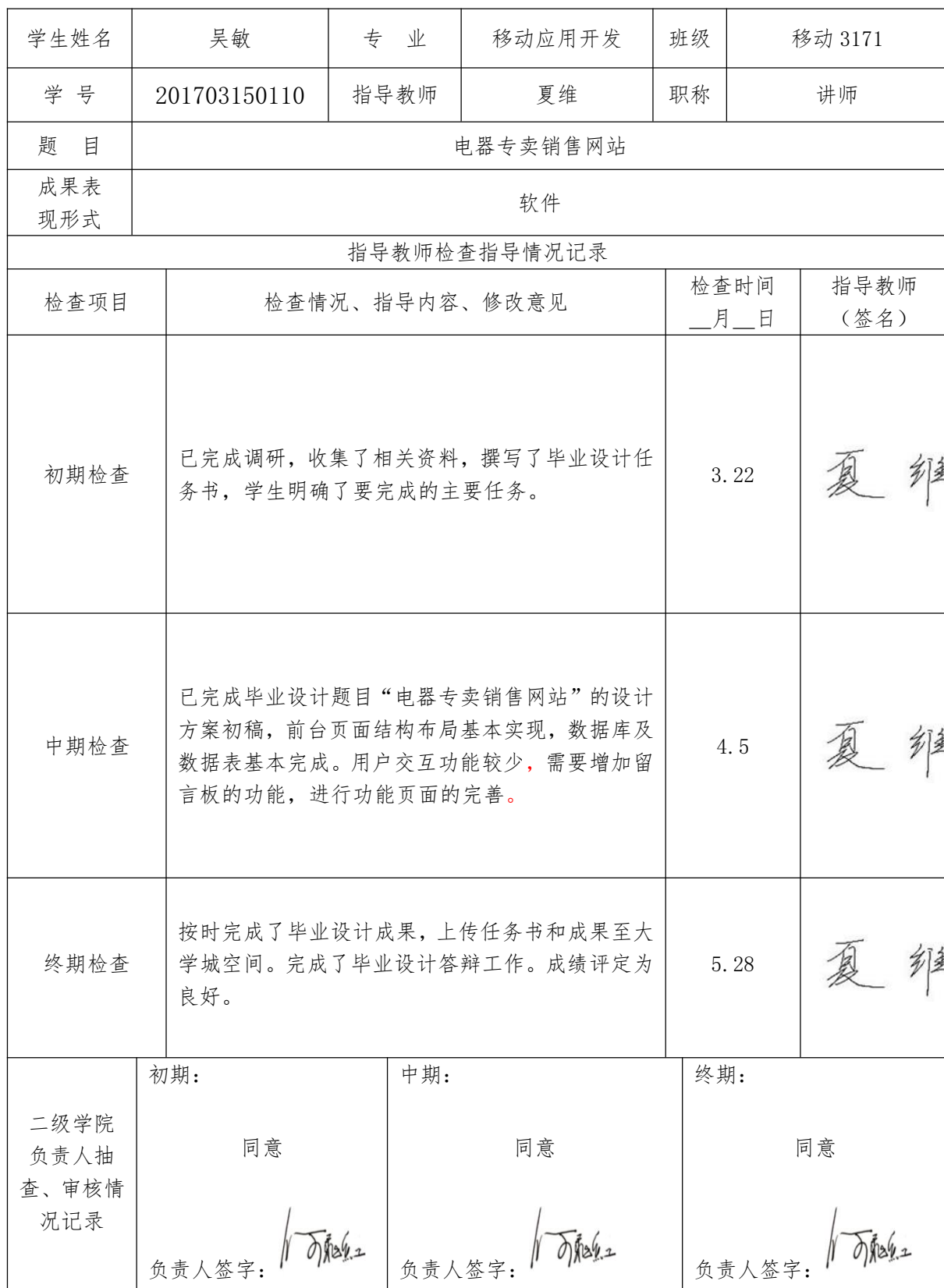
湖南石油化工职业技术学院毕业设计指导检查记录

注意: 1、初期检查内容为设计任务案(专业性、实践性和工作量情况);中期检查内容为设计实施过程(可行性、完整性、可靠性);终期检查的内容为作品或产品成果和学生毕业设计成果(说明书)的完成情况及质量(科学性、规范性和完整性、实用性)。其内容要真实、详细、具体。