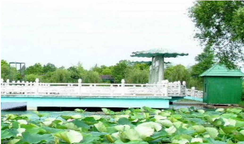
图 1 团湖荷花公园

对于团湖公园存在的一些问题，例如公园的知名度不高、宣传力度不够、投资力度不够等问题，针对团湖公园在运营中所存在的问题，设计了一份合理的营销活动策划方案，包括在竞争激烈的市场中举办一些活动，包括在荷花节举行各种活动，对所举行的活动进行宣传，以此扩大团湖公园的影响力，从而提高知名度。