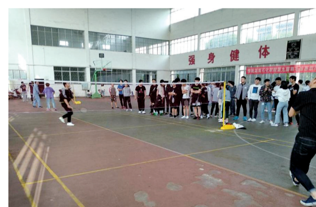
了同学们的课余生活，促进了同学们的健身运动，更团结了同学之间、系部之间的团结友爱、温馨和谐。

整个比赛中，大家欢声笑语，充满活力，展现了同学们积极向上的精神面貌，加强了团体凝聚力，不仅丰富了同学们的课余生活，促进了同学们的健身运动，更团结了同学之间、系部之间的团结友爱、温馨和谐。(巨有君)