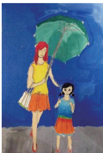
电闪雷鸣，而我的心却十分安定。