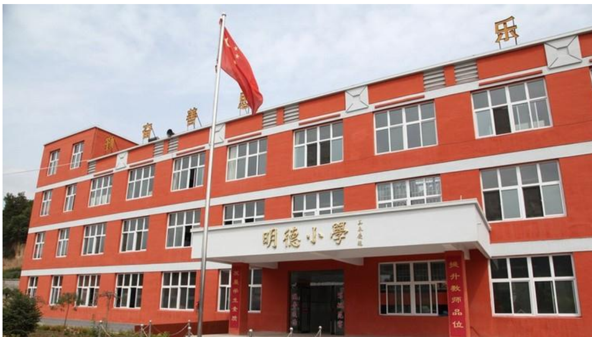
图 1 明德小学教学楼

现今，传统教育在社会上得到的认可越来越低，我们更加看重学生的天性，开始认为学生的能力、创新意识和整体素质应着重培养。开始使用兴趣教育方案，在兴趣和动机下,加强学习的深度,激发学生的潜能。对于我国小学英语教育课堂中存在的一些问题，如针对现阶段教育情况,我认为把兴趣和教育结合在一起有一定的难度。针对这个问题，到明德小学进行考察，设计一套兴趣教育框架模式。能将兴趣教育真正融入到课堂中,这对提升学生的学习水平和能力是有很大大益处的。