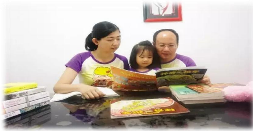
图 6 家长带着孩子阅读