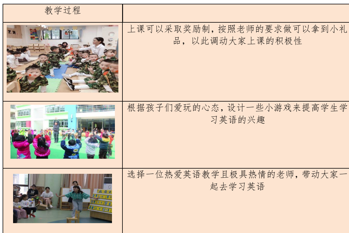
表 5 教学过程

英语的启蒙教育是一个漫长的过程，对于孩子们来说，尽早地进入英语环境很重要。语言环境对她们能否学好英语更为重要，幼儿具有一种独特的自然吸收、自然学习语言的能力。当然带动孩子们一起学习的启蒙老师也是非常重要的，与一位热爱英语对英语比较有感悟的人一起学习也更能够带动起孩子们对英语的兴趣。以下是教学过程中的具体激励措施：