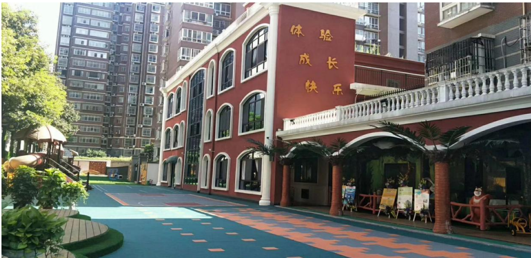
图 1 Speechless 幼儿园外景图

英语是中国人必不可少的一门语言，所以从小打好英语基础也是家长十分重视的一件事。但是 Speechless 幼儿园在英语教学方面还存在着一些不足之处，比如对幼儿的性格特点把握上不够准、孩子的注意力在学习时不容易集中，教育资源分配不均匀教师自身的素质也有待提高，以及课后没有营造一个好的学习英语环境，我在幼儿园实习过程中和园内教师一起针对这些问题做出了一些相应的应对优化方案，为了不辜负所有孩子以及所有的家长们对我们幼儿园以及我们老师的信任。