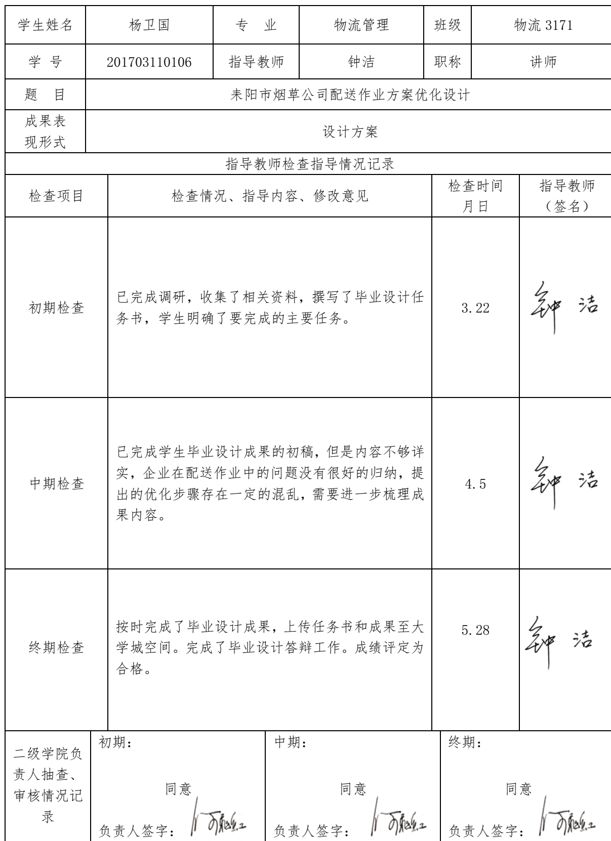
湖南石油化工职业技术学院毕业设计指导检查记录

注意: 1、初期检查内容为设计任务案(专业性、实践性和工作量情况);中期检查内容为设计实施过程(可行性、完整性、可靠性);终期检查的内容为作品或产品成果和学生毕业设计成果(说明书)的完成情况及质量(科学性、规范性和完整性、实用性)。其内容要真实、详细、具体。