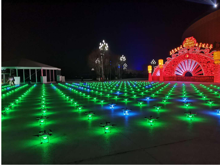
图 1 飞机摆放